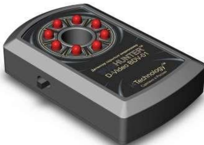
Рисунок 1 – внешний вид изделия