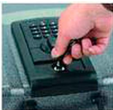
Для открытия вставьте механический ключ, и поверните его в позицию «open» (открыто).