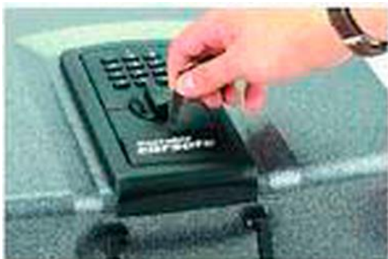
Подденьте крышку механического замка пластмассовым стержнем

Обратите внимание: пока не установлены батареи для первого открывания автомобильного сейфа используйте механический ключ.