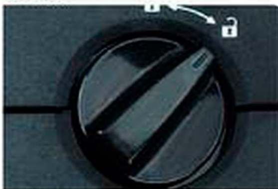
Установите поворотный переключатель в позицию «open» (открыто).

Панель электрического замка будет доступна только после установки в батарейный отсек 5 щелочных батарей. Установка элементов питания производится после открытия сейфа механическим ключом.