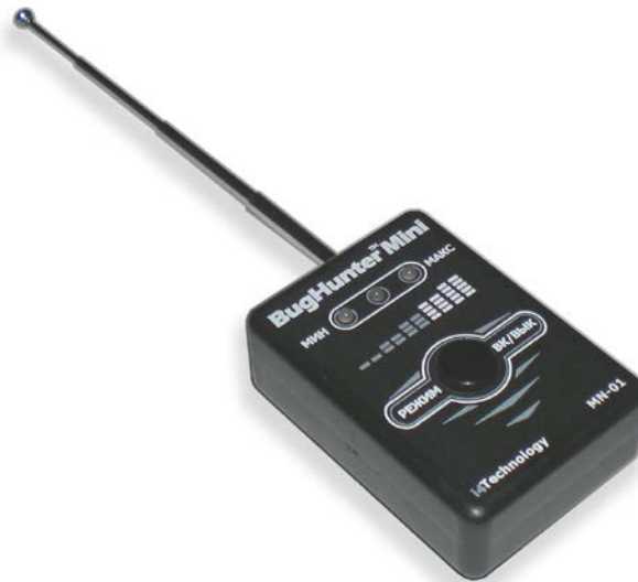
Рисунок 1 – внешний вид изделия

1.2.1 Внешний вид изделия представлен на рисунке 1