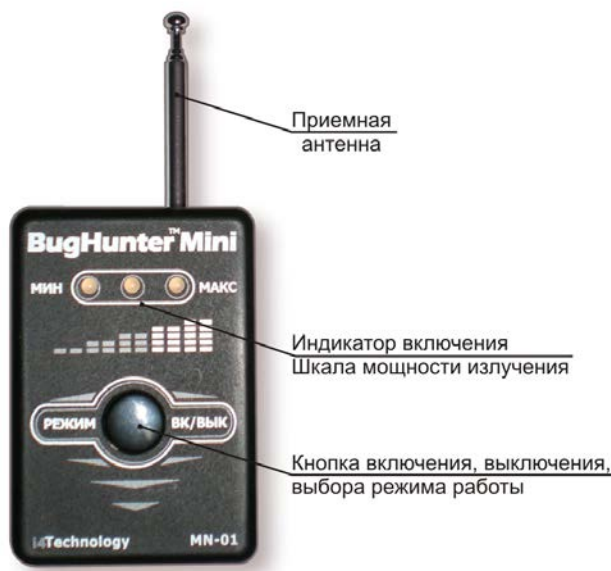
Рисунок 2 – расположение основных частей изделия

1.3.2 Расположение основных частей изделия представлено на рисунке 2.